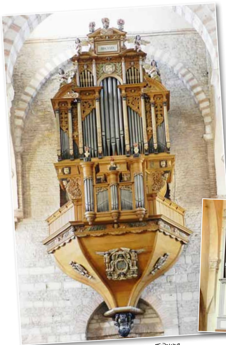
Tournus - Tribune

C'est l'orgue le plus remarquable du département par son ancienneté mais aussi par la beauté et l'originalité de son buffet. Placé en nid d'hirondelle au-dessus de l'entrée ouest de l'église, il remonte à 1629 et est dû à Jehan Deherville pour la partie sonore et à Gaspard Symon pour la partie « hucherie ». On ne sait strictement rien sur sa composition d'origine pas plus que sur les diverses interventions qu'il a subies au cours des siècles. La dernière, en 1930-32, lui a été fatale puisqu'opérée par un facteur peu scrupuleux et maladroit. En 1964, avec ma future équipe des « Amis de l'Orgue de Mâcon et sa région », nous avons découvert un orgue encombré de gravats, de déjections de rats et de pigeons. Il était totalement muet et inutilisable. Il se serait fait entendre, paraît-il, pour la dernière fois en 1945 (?). Nos investigations dans le buffet