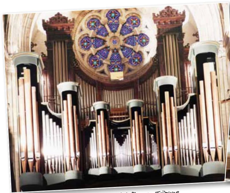
Mâcon Saint-Pierre - Tribune