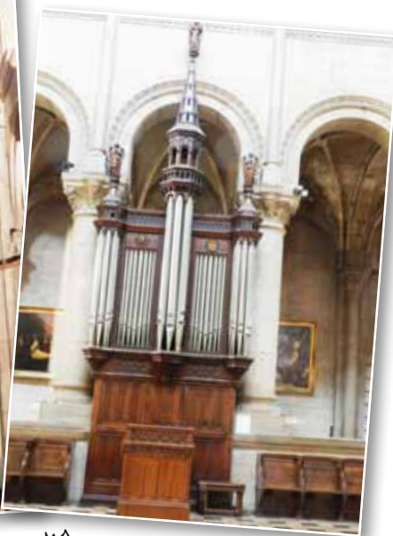
Mâcon Saint-Pierre - Choeur