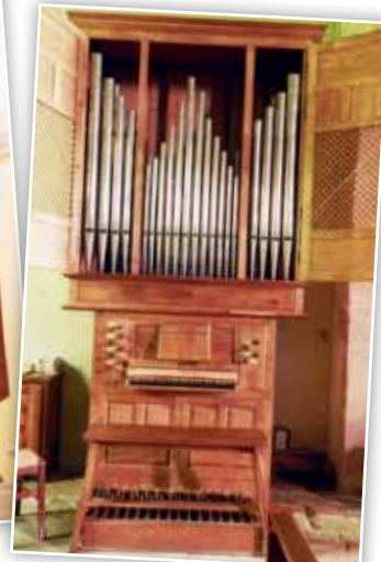
De gauche à droite : Mâcon Saint-Clément, Mâcon Temple protestant, Saint-Laurent-sur-Saône, Charnay-lès-Mâcon.