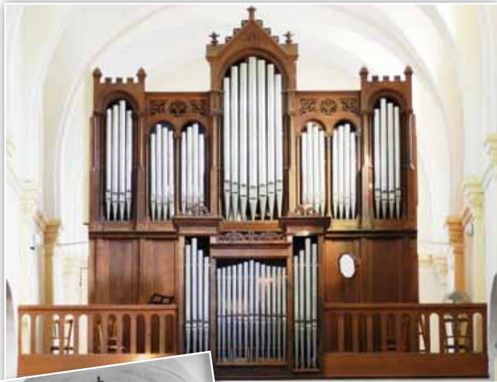
Gueugnon hier et aujourd'hui