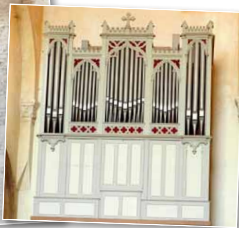
Tournus - Chœur