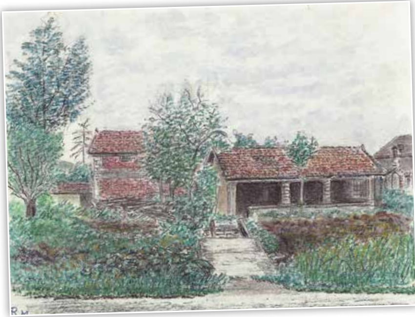
Lavoir de la Folie situé rue de la Cozanne, construit au XIX e siècle, transformé en garage pour la commune (juin 1980).