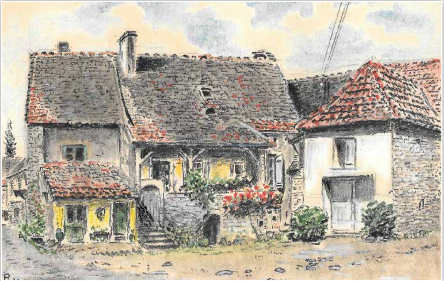
1. Maison Lacroix : maison à auvent située rue du Milieu ; elle est en cours de rénovation.