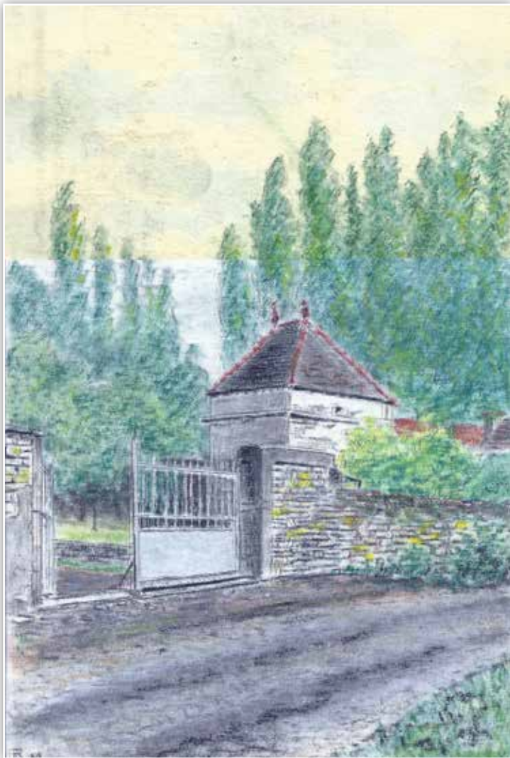
Pigeonnier du XVIII e siècle, encore visible depuis la rue de la Cozanne.